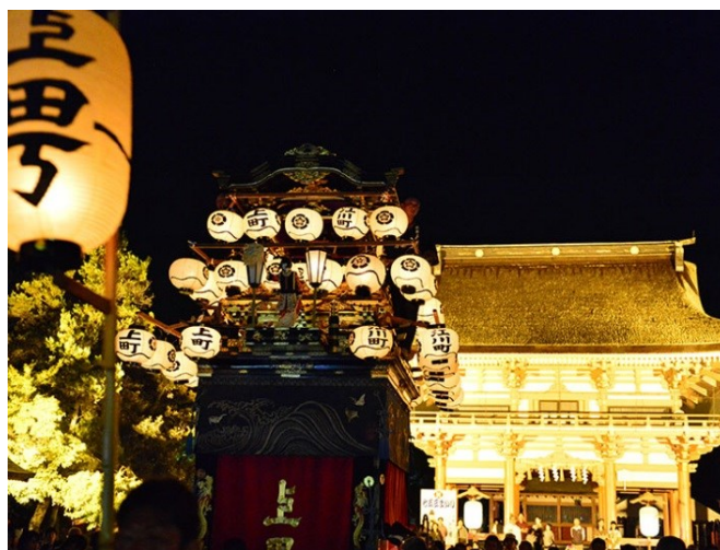
【尾張津島秋まつり】